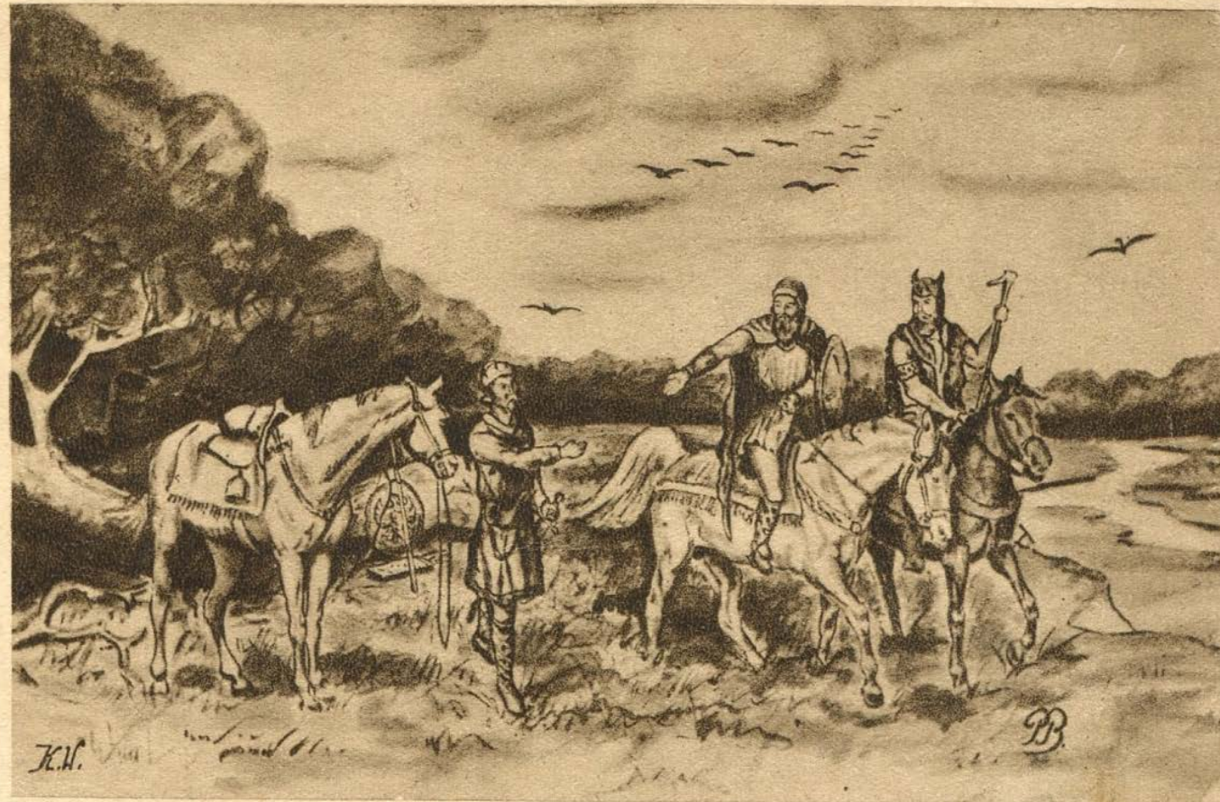
LECH, CZECH I RUS.